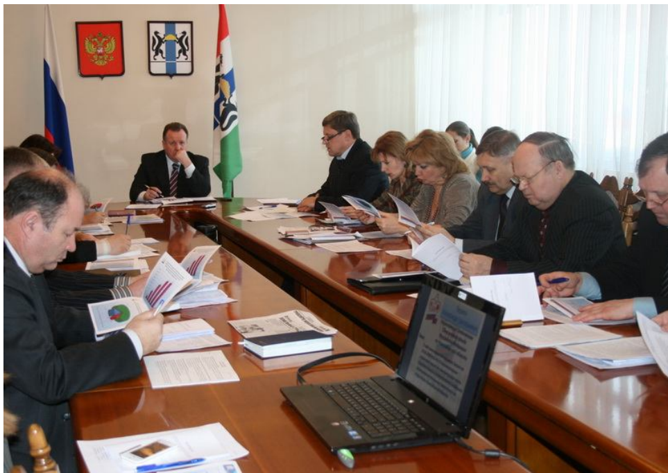
Выступление управляющего ОПФР по Новосибирской области на заседании комиссии по вопросам пенсионной реформы