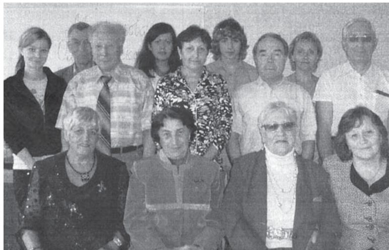
Выпускники первых компьютерных курсов в 2007 году

В 20-ти часовую программу обучения входили лекции и практические занятия (работа на компьютере, технология обработки текстовой информации, работа в интернете, поиск информации и т. д.).