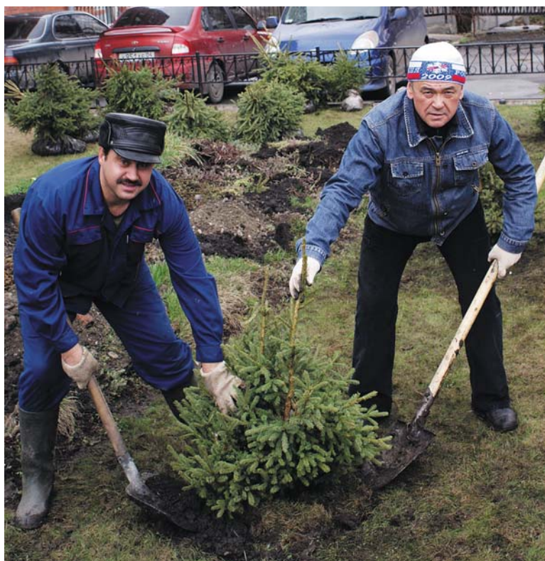
Сотрудники ОПФР по Республике Алтай закладывают сквер памяти Героев